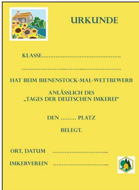
Urkunde DIN A5

www.deutscherimkerbund.de/index.php?ergaenzungsblaetter