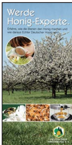
Faltblatt "Werde Honig-Experte"