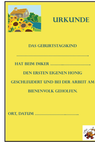
Urkunde DIN A5