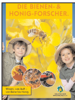
Broschüre DIN A4, 16 S. "Die Bienen & Honig-Forscher"