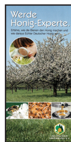
Faltblatt DIN lang "Werde Honig-experte"