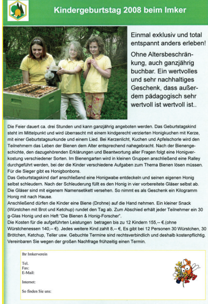
Flyer DIN A4

Vorlagen finden Sie zur Unterstützung auf unserer Homepage: www.deutscherimkerbund.de/index.php?oeffentl