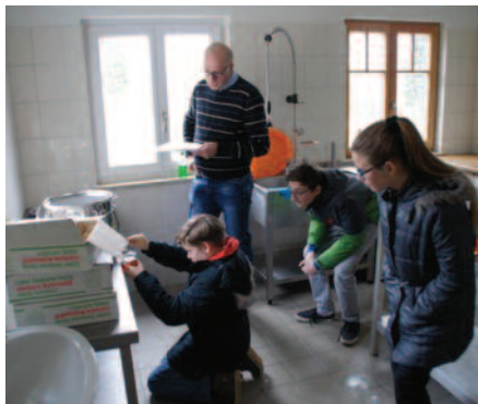
Beim Abfüllen des Honigs war Fingerspitzengefühl gefragt.

gefordert, denn bei zu großen Abweichungen gab es Punktabzug. Mit ihren fundierten Kenntnissen schnitten die drei Chamer Schüler in der Gesamtbilanz letztendlich am besten ab.