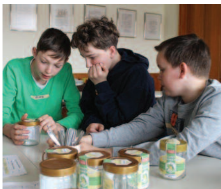
Welcher Aufmachungsfehler wird hier gesucht?

„Wir wollen das stärkste Team ins Rennen schicken“, so die Position der Jugendlichen vor dem ersten Hessischen Jugendimker-Wettbewerb in Kirchhain. Zwei Gruppen mit Schülern der Integrierten Gesamtschule in Stierstadt (IGS) und vom Imkerverein Bad Soden-Allendorf (BSA) waren sehr gut vorbereitet und stellten sich den anspruchsvollen, imkerlichen Fachthemen.