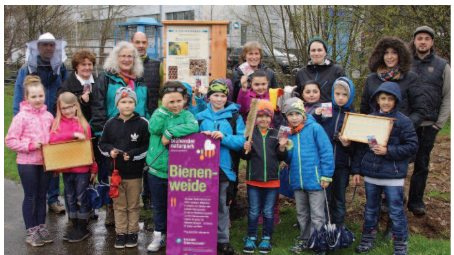
Die Partner der Honeyversity gemeinsam mit der Bienen-AG der Anne-Frank-Schule bei der Einweihung des Bienenlehrpfades.

In Zusammenarbeit mit der Hochschule Furtwangen University (HFU), dem Regionalen Kompetenzzentrum für Bildung für Nachhaltige Entwicklung im Südschwarzwald (RCE), den Naturparkschulen Südschwarzwald und dem Bauern-