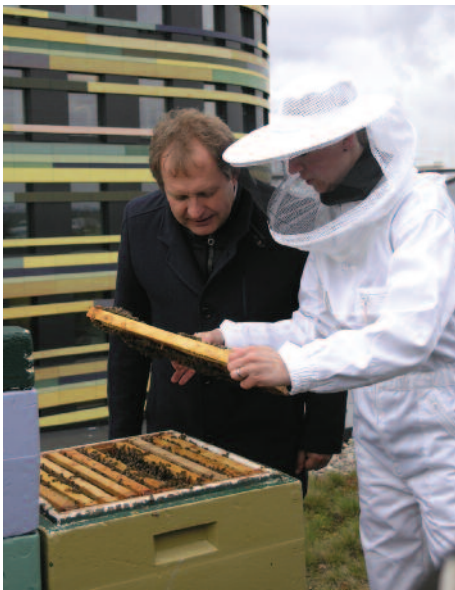
Imkerin Gesa Lahner zeigt Umweltsenator Jens Kerstan die Völker.

In einer Pressemeldung teilte der Hamburger Senat am 25. April mit, dass ab sofort auf dem Gründach der Umweltbehörde in Wilhelmsburg vier Bienenvölker stehen.