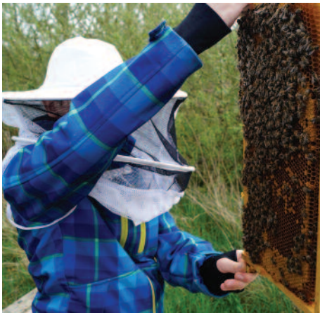
Das Arbeiten am Bienenvolk - eine der umfangreichsten Wettbewerbsaufgaben.