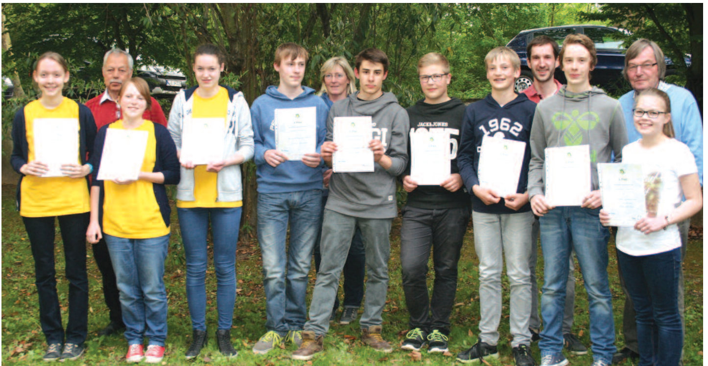
Foto unten: Die glücklichen Sieger mit ihren Betreuern: V. l. n. r. Team Württemberg, Team Rheinland-Pfalz und Team Westfalen-Lippe.