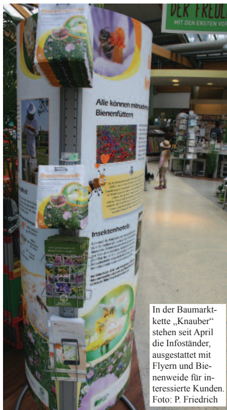
In der Baumarktkette „Knauber“ stehen seit April die Infoständer, ausgestattet mit Flyern und Bienenweide für interessierte Kunden.