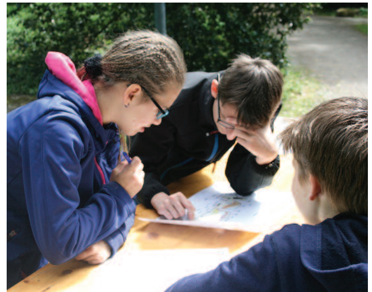
Fotos obere Reihe v. l. n. r.: An der Station 5 wurden Rähmchen gefertigt. Die Mittelwände mussten selbst gegossen werden. An Station 4 „Bienenweide“ mussten die Schülerinnen und Schüler zuerst allein an einem vom Imkerverband Rheinland-Pfalz selbst entworfenen und hergestellten Spiel 10 Pflanzen die richtigen Namen zuordnen, ehe jedes Team gemeinsam im Park noch einige Pflanzen finden musste.