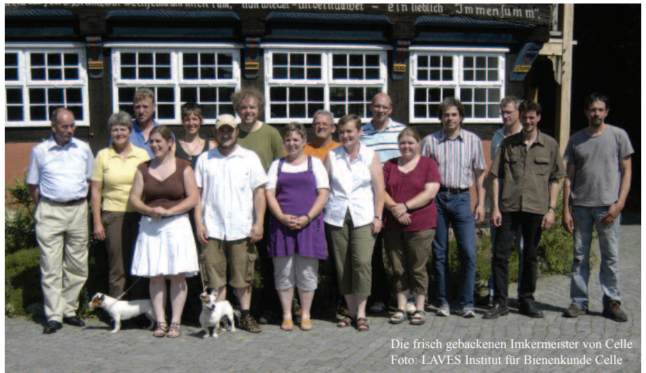
Die frisch gebackenen Imkermeister von Celle

Die 14-köpfige Prüfungskommission setzt sich aus folgenden Berufsgruppen zusammen: Berufs-