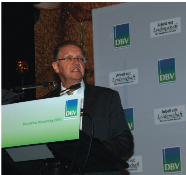
Der Präsident des Deutschen Bauernverbandes, Gerd Sonneleitner, bei seiner Grundsatzrede vor den Deligierten