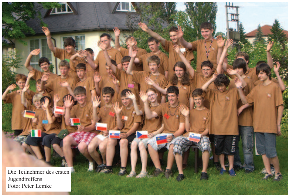
Die Teilnehmer des ersten Jugendtreffens

Außerdem gab es botanische Fragen, bei denen die Jugendlichen zehn Trachtpflanzen erkennen sollten. Auch hier gab es Stolpersteine wie die japanische Zierquitte oder die Edelkastanie.