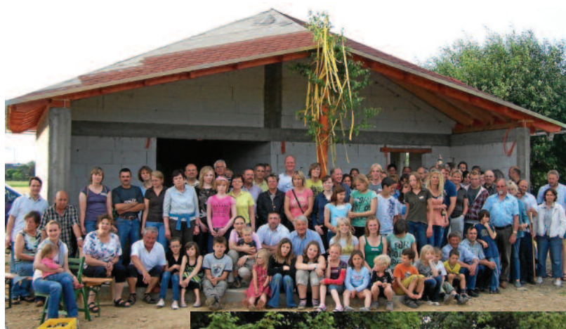
So schön kann Vereinsleben sein: Der IV Alme-Lippe baute mit seinen Mitgliedern ein Bienenhaus, auf das alle stolz sind und unternimmt mit seiner Jugendgruppe interessante Reisen ins Ausland.