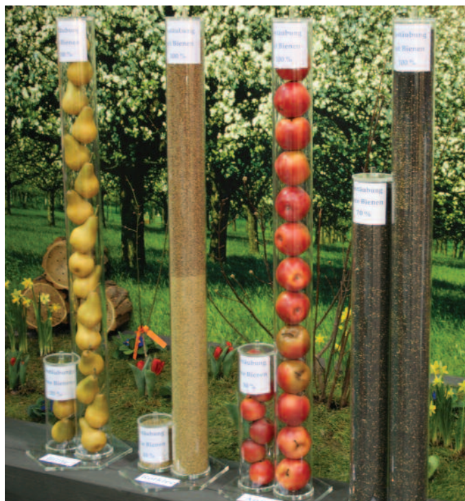
Am D.I.B.-Stand auf der Internationalen Grünen Woche Berlin 2010: In Acrylglssäulen wird der Ertrag von Kulturen mit und ohne Bienenbestäubung dargestellt.

Alle Mitglieder der übrigen Imker-/Landesverbände müssen nach wie vor den üblichen Bestellweg über ihren Vereinsvorsitzenden und Imker-/Landesverband einhalten.