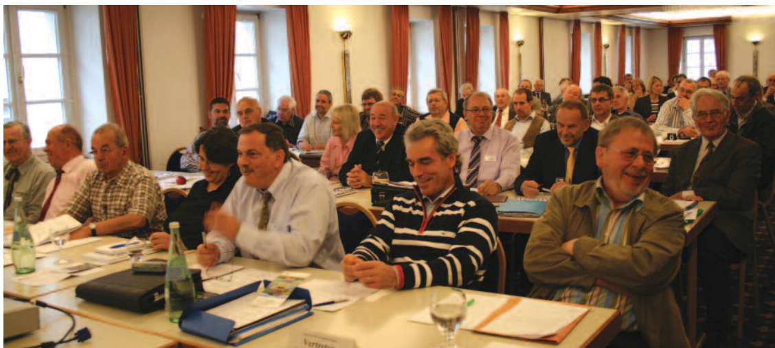
Foto: Die Vertreterversammlung in den Tagungsräumen des Hotels „Weißer Hase“ in Passau.

Da es bereits solche Messgeräte gibt, wurde der Antrag mehrheitlich abgelehnt.