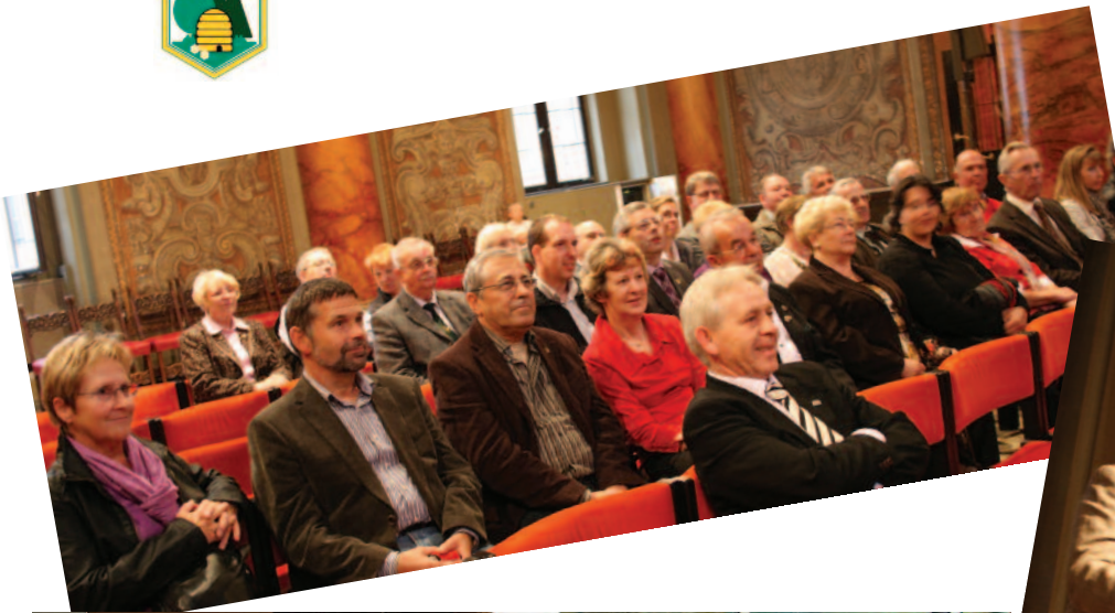
Foto links: Die Delegierten werden im Passauer Rathaus empfangen.