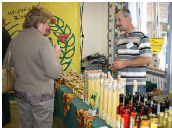
Eine Fachausstellung umrahmte das Festprogramm.